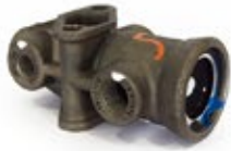
Válvula Protección TP-3 Aplicación: Camiones Americanos Código: 279000N - 3H1721H