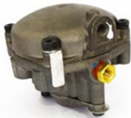
Válvula Relé RG-2 Aplicación: Remolques Código: 281865N - 2F1521H