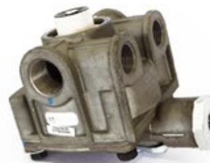
Válvula Relé R-14

Aplicación: Universal Código: 800515 - 1G3021H