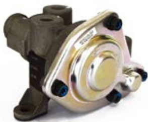
Válvula Relé SR-1

Aplicación: Camiones Americanos - Remolques Código: 286364N - 3H0521H