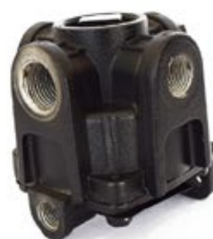
Válvula Relé RG-2

Aplicación: Freightliner Código: KN28060X - 1K3119X