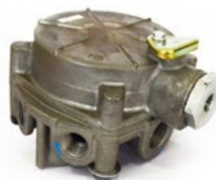
Válvula Relé R-8 Aplicación: Camiones Americanos Código: 286370N - 3H2621H