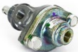
Válvula Control PP-1 Aplicación: Camiones Americanos Código: 276567N - 1J0321H