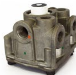
Válvula Relé R-12 Horizontal - Vertical Aplicación: Universal Código: 065303 - 2H3121H