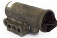
Gobernador de Aire D-2 Aplicación: Scania - Camiones Americanos Código: 275491