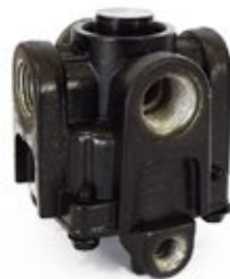
Válvula Relé RG-2

Aplicación: Camiones Americanos - Remolques Código: 286364N - 3H0521H