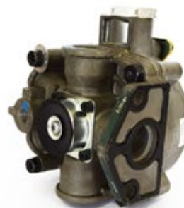
Válvula Relé R-8

Aplicación: Remolques Código: KN28500X - 1F1021X