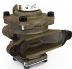
Válvula Relé Descarga R7 Aplicación: Camiones Americanos Código: 103081N - 2H0621H