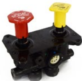
Válvula Freno de mano MV-3,5 Salidas

Aplicación: Camiones Americanos Código: 286370N