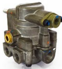
Válvula Relé SR-7 Aplicación: Camiones Americanos Mixer Código: K021558 2H1121H