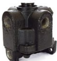
Válvula Relé RG-2

Aplicación: Remolques Código: KN28510X - 1D0621X