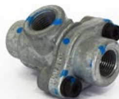
Válvula Doble check o Doble Retención Código: 278614N - 1G0121H