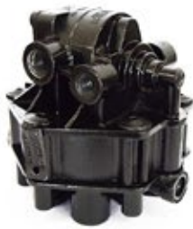
Válvula Relé FF-2. Aplicación: Camiones Americanos - Remolques Código: KN 28600