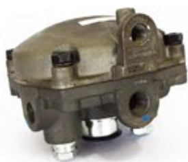
Válvula Relé R-6 Código: 279180N - 1J0721H